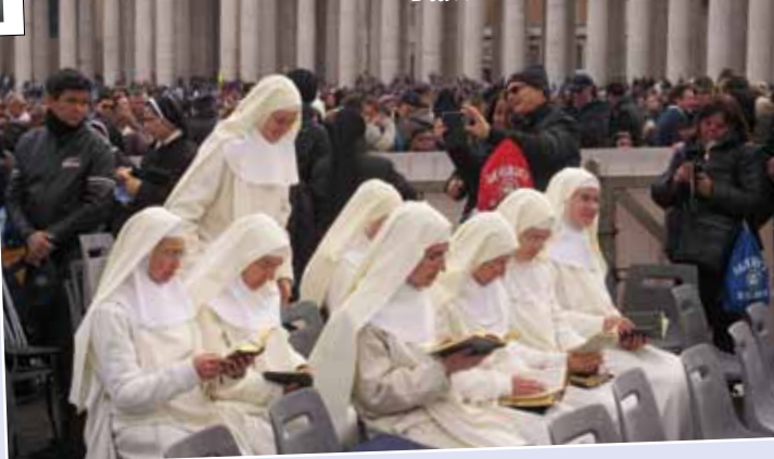
Place Saint-Pierre – 8 décembre