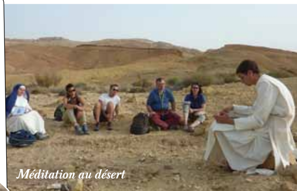
Méditation au désert