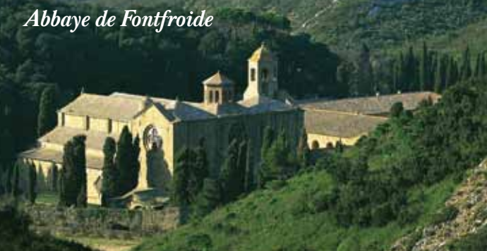
Abbaye de Fontfroide