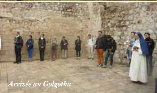
Arrivée au Golgotha